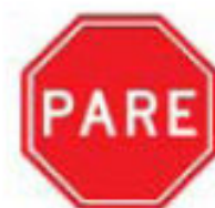
R-1 Parada obrigatória